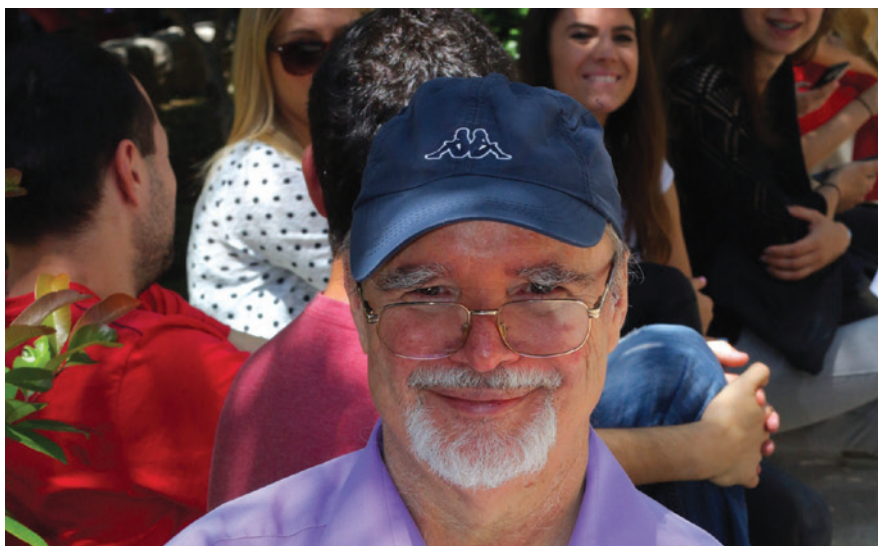
Sliku autora ove Zbirke pjesama napravio je Vitimir Juretić prilikom svečanosti dodjele počasnog zvanja profesora emeritusa na Sveučilištu u Splitu 15. lipnja 2016. godine. U pozadini su studenti Medicinskog fakulteta.