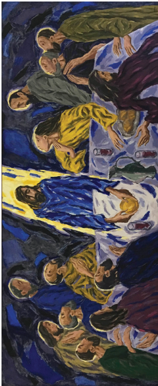
Slika Dure Sedera Posljednja večera u dvorani savršene akustike Dominikanskog samostana u Dubrovniku. Objavu fotografije slike u ovoj knjizi odobrio je autor slike umjetnik Seder.